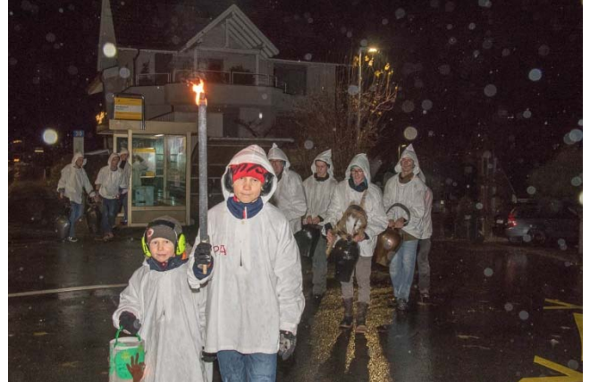
Die Corona-Regeln standen im Vordergrund