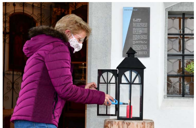
Die Sakristane waren alle zur Mithilfe bereit. Danke.