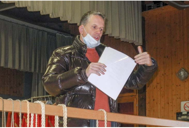
Ein zufriedener OK-Chef zieht Bilanz.