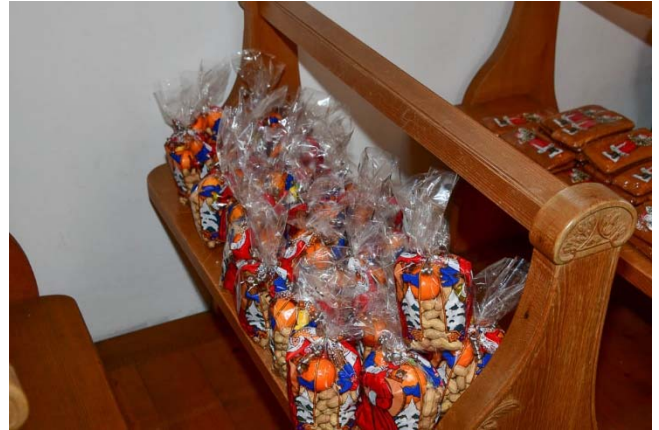
Die Bescherung wurde zur «Selbstbedienung» bereitgestellt.