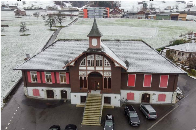
Das Schützenhaus blieb einmal mehr Zentrum der Aktivitäten.

Nicht der Samichlais sollte um Einlass bitten, sondern die Bevölkerung wurde eingeladen, den Samichlais an verschiedenen Orten zu besuchen.