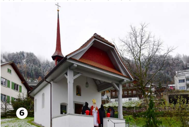
St. Anna