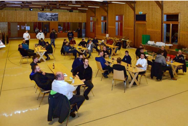
Dieses Jahr gab es kein Dankessen. Zusammensitzen war angesagt.