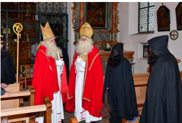
Samichlaise beim Wechsel unter sich.