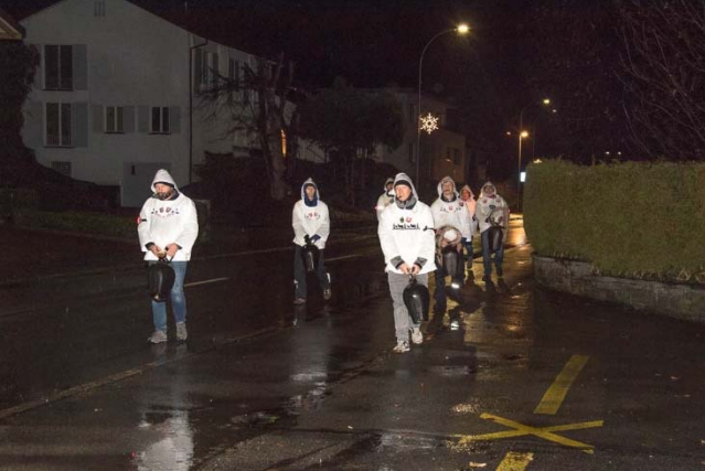
Es sei getrichelt worden.