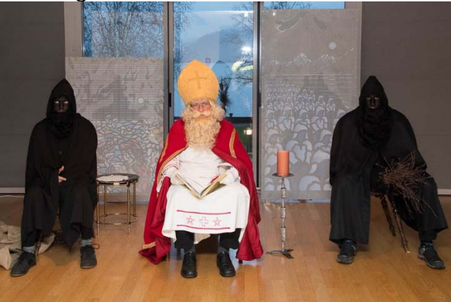
Dekoration in der Ermitage von Markus Amstad.