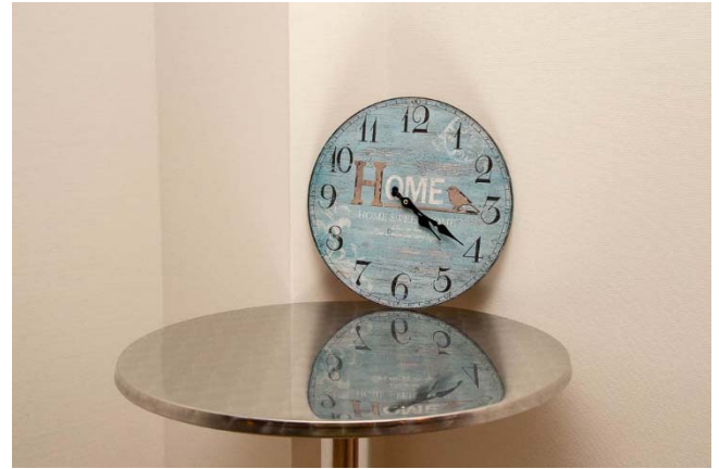
Ein Zeitfenster dauerte 15 Minuten.