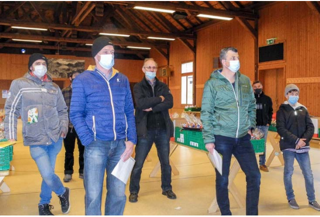
Instruktionen wurden mit Masken entgegen genommen.