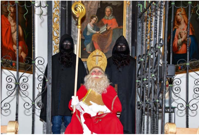
Hinter dem Samichlais thront »Mutter Anna«.