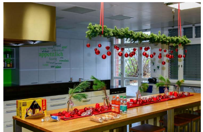
Verpflegung im Warteraum.